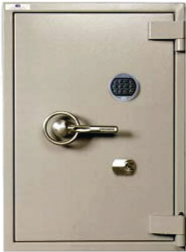
Arme Courte - Classe III