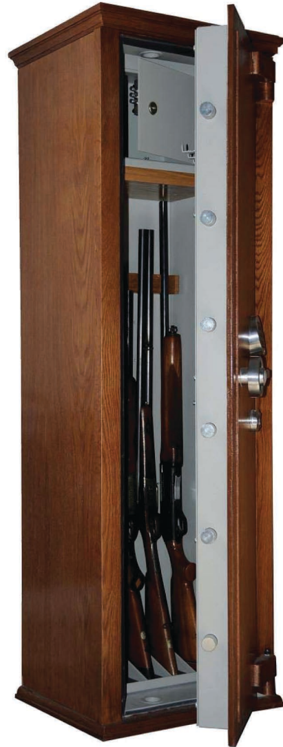
Arme Longue - Classe I

Tous les modèles de coffres-forts ont été testés dans les laboratoires les plus prestigieux, certifiant les classes de sécurité selon la certification officielle correspondante. Notre production est certifiée par Appius, garantissant ainsi que le produit livré possède les caractéristiques de construction identiques à celles du produit testé.