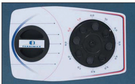
Cerradura Serie MM Serrure Série MM