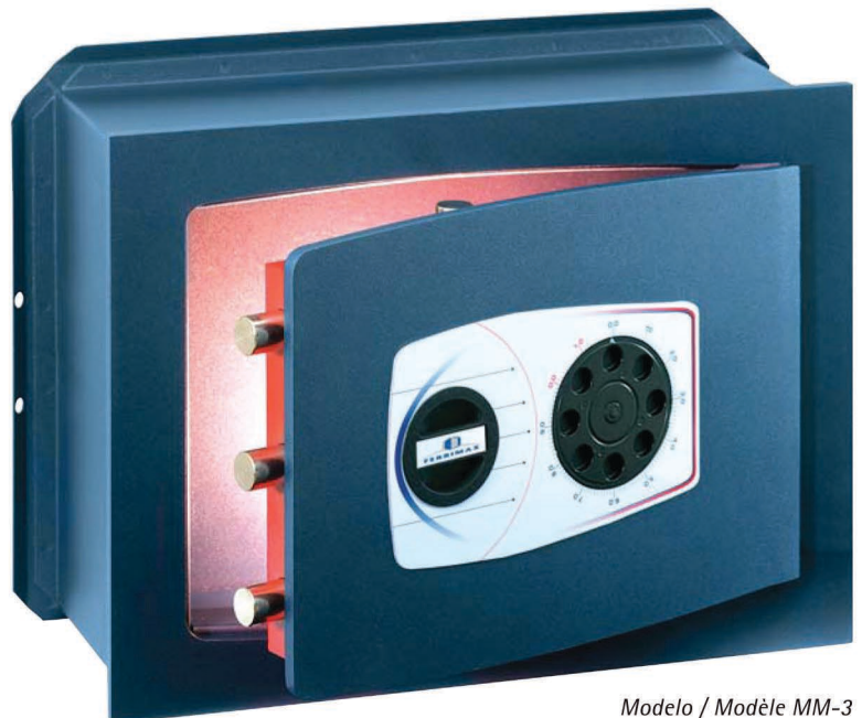
Modelo / Modèle MM-3