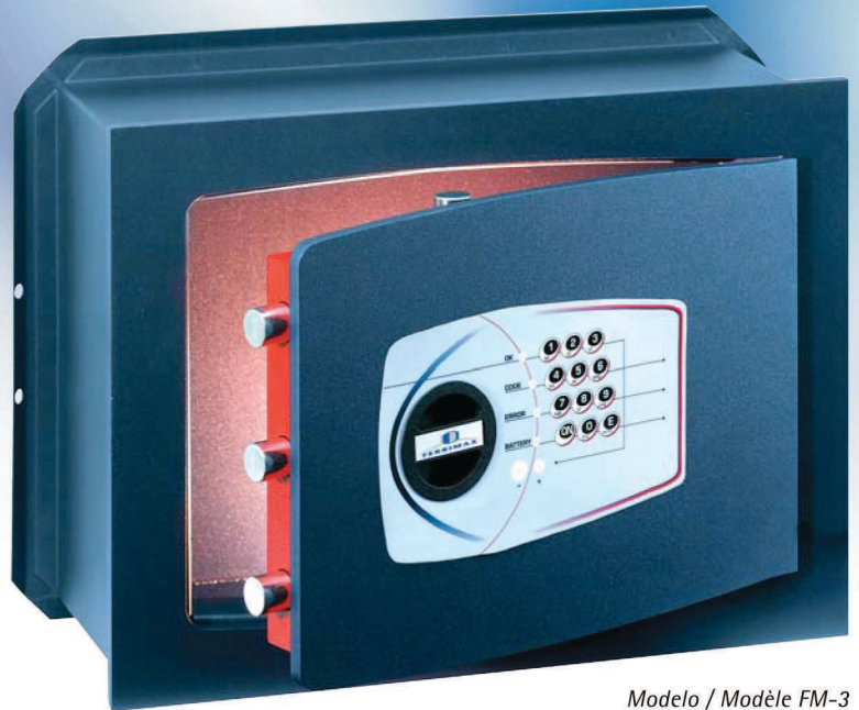
Modelo / Modèle FM-3

L'Association Espagnole de Normalisation (AENOR) a certifié que le Système de Gestion de la qualité adopté par Ferrimax, s.a. pour le développement, la production, la commercialisation, le service après-vente et la maintenance des coffres-forts et des produits de sécurité physique, comme portes-forts et blindages spéciaux, est conforme aux exigences de la nouvelle norme ISO 9001 : 2000.