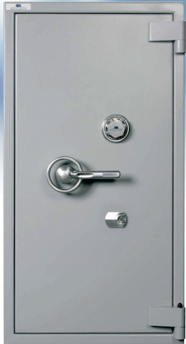
Classe III combinaison optionnelle